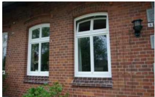
Erneuerte Fenster in Ziegelgebäude