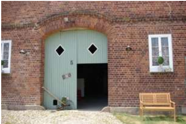
Groot Dör mit Klöntür und Oberlicht zur Belichtung der Diele

Die „Groot Dör“ ist ein prägendes Element der norddeutschen Wohnwirtschaftsgebäude, insbesondere der niederdeutschen Hallenhäuser. Das zur Diele führende Tor ist zweiteilig mit einem feststehenden Dössel in der Mitte. Bei notwendigen Erneuerungsmaßnahmen oder Veränderungen durch andere Nutzungsbedürfnisse sollten die Tore in ihrem Charakter bewahrt werden. Dies beinhaltet die Verwendung von Holz (naturbelassen oder mit einem Anstrich in einem grünen, braunen oder blauen Farbton), den Erhalt der Torbalken und die Betonung der Senkrechten. Von vollständigen Verglasungen und fensterähnlichen Sprossengliederungen der historischen Toröffnungen ist möglichst abzusehen.