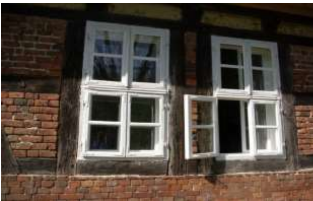
Historisches Fenster in Fachwerkhaus

Bei der Erneuerung sollten Holzfenster verwendet werden. Sie bieten viele Möglichkeiten der Profil- und Farbgestaltung. Holzfenster lassen sich überdies besser korrigieren und reparieren. Bewährt ist der historische weiße Farbanstrich, da er aufgrund der Farbpigmente und der Widerstandsfähigkeit gegen Sonnenlicht sehr langlebig und pflegeleicht ist. Alternativ kann man ein widerstandsfähiges Holz ggf. mit Lasur oder Leinölfirnis verwenden (Eiche oder Lärche). Die Fenster sollten mit einer konstruktiven Teilung in Oberlicht und zwei Flügel versehen werden, die ergänzend durch schmalere Sprossen gegliedert werden können. Möglich ist auch die sogenannte Wiener Sprosse. Unbedingt zu vermeiden sind hingegen Sprossen, die zwischen den Scheiben eingelegt werden, sogenannte Sprossen „in Aspik“.