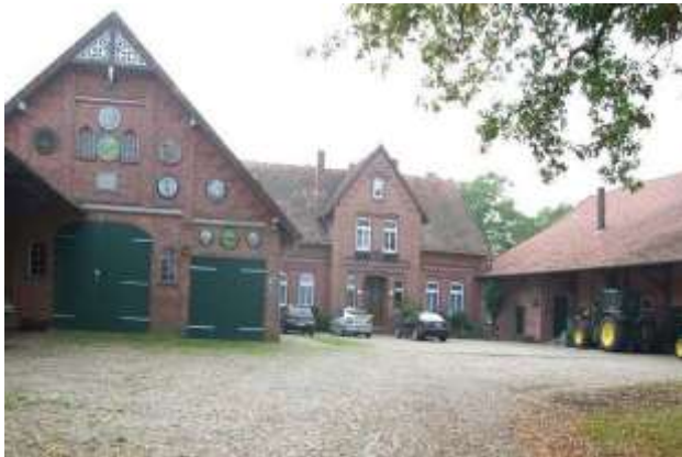
Dreiseitige Hofanlage in Bierde

Photovoltaik- und Solarthermie-Anlagen stellen bei ortsbildprägenden Gebäuden eine Störung dar und sollten möglichst nur auf modernen Hallendächern installiert werden, sonst möglichst so, dass noch ein Ziegelanteil sichtbar bleibt. Da diese Anlagen in der Regel bereits staatlich subventioniert sind, ist eine zusätzliche Förderung durch die Dorfentwicklung ausgeschlossen.