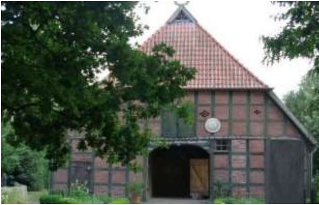
Fachwerk mit Ziegelausmauerung

Typisch sind zudem Fassaden mit massivem roten Ziegelmauerwerk aus der Wende vom 19. zum 20. Jahrhundert, die mit Gesimsen und Zierbändern aus Formsteinen verziert sind. Die Sohlbänke der Fenster sind meist mit glasierten Ziegeln ausgestattet. Diese alten Ziegelfassaden können durch schonende Reinigung, einen offenporigen Schutz und eine Erneuerung der Fugen wieder wetterfest gemacht werden. Stark geschädigte Ziegelsteine müssen ausgewechselt werden. Bei der Verwendung von neuen Ziegeln ist darauf zu achten, dass die Steine eine glatte Oberfläche haben und lebendig rot sind.