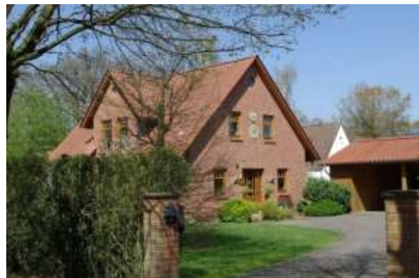
Beispiel für Neubau im Dorf

In der Dorfregion kommen insbesondere in Bierde und Otersen häufig dreiseitig geschlossene Hofformen vor. Typisch sind auch winkelförmige Gebäudekomplexe. Für die Raumbildung der Hofstellen sind neben dem Hauptgebäude auch die Nebengebäude wie Scheunen, Speicher, Remisen und Schuppen relevant. Diese charakteristische Baustruktur sollte auch beim Abriss von Gebäuden erhalten bleiben, beispielsweise durch Bildung von Hausgruppen und Errichtung von Garagen, Carports oder Kellerersatzräumen in dorftypischen Formen und Materialien.