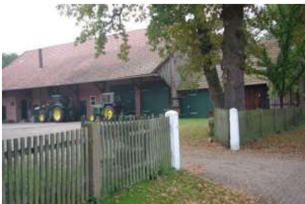
Holzstaketzaun mit schmalen Latten

Als Einfriedung zum Straßenraum sind in der Dorfregion „von Bierde bis Wittlohe“ Holzstaketzäune üblich. Die Latten sind schmal (ca. fünf Zentimeter) und abgeschrägt. Typisch sind außerdem Ziegelmauern. Weiterhin sind Schnitthecken aus Hainbuche, Rotbuche, Liguster und Weißdorn verbreitet, erfreulicherweise auch an neubebauten Grundstücken. Bei Erneuerung oder Ersatz der Einfriedung sollten diese traditionellen Elemente verwendet werden. Holzstaketzäune können auch mit einem Ziegelsockel und -pfeilern kombiniert werden. Auf regionaluntypische Zäune wie Friesenzäune (weiß lackiert, mit geschwungenen Lattenelementen), Bohlenzäune mit waagerechten Latten oder strukturierte Beton-Formsteine mit Zaunaufsatz sollte hingegen verzichtet werden. Dies gilt auch für Hecken aus Thuja (Lebensbaum), die einen eher abweisenden Charakter haben und sich nicht in das alte Holz zurückschneiden lassen wie Laubhecken. Untypisch sind auch Hecken aus Kirschlorbeer.